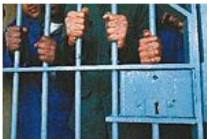
Kinderen opsluiten is crimineel